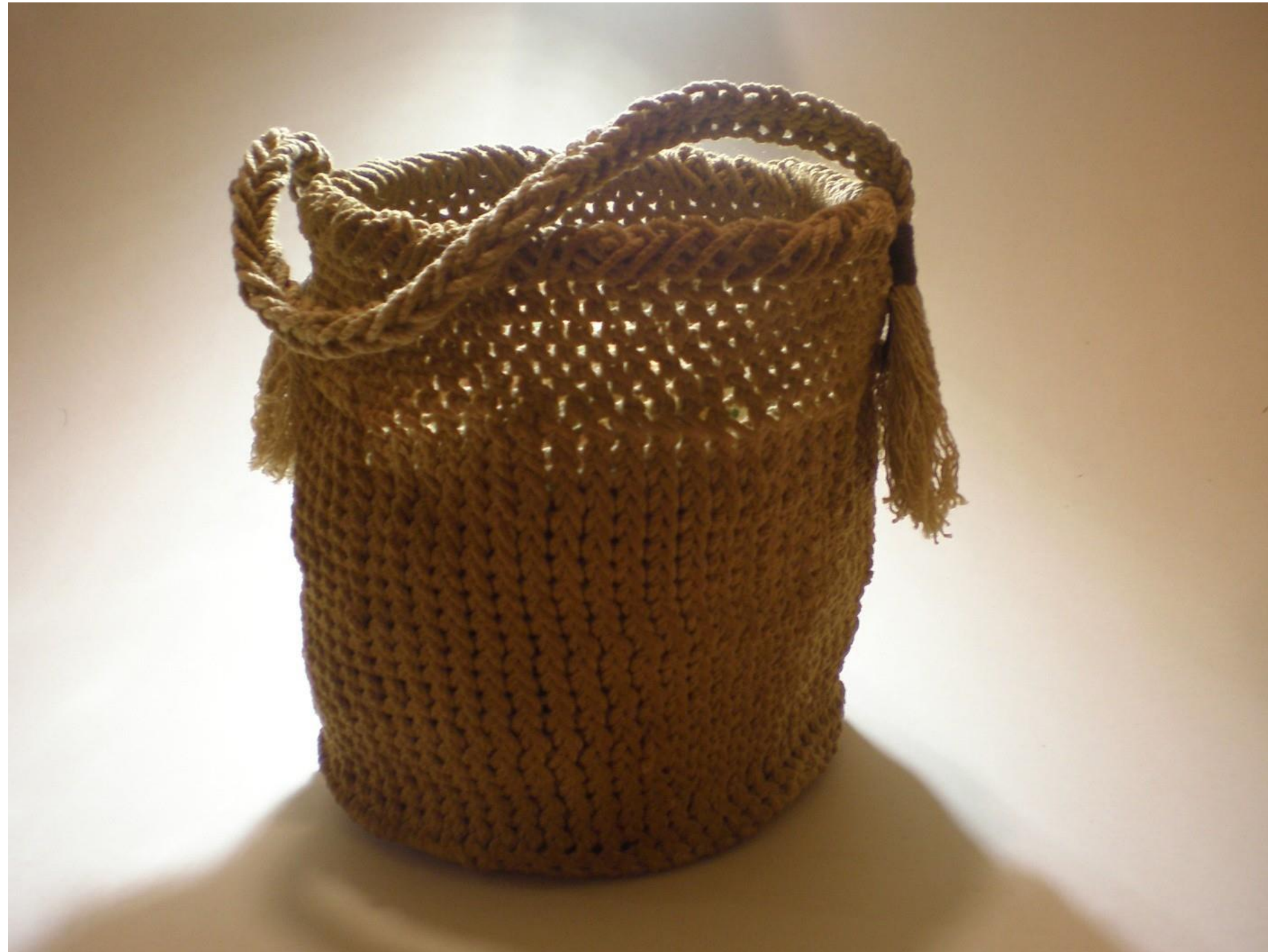
Bolso en técnicas de Anillado simple y cruzado