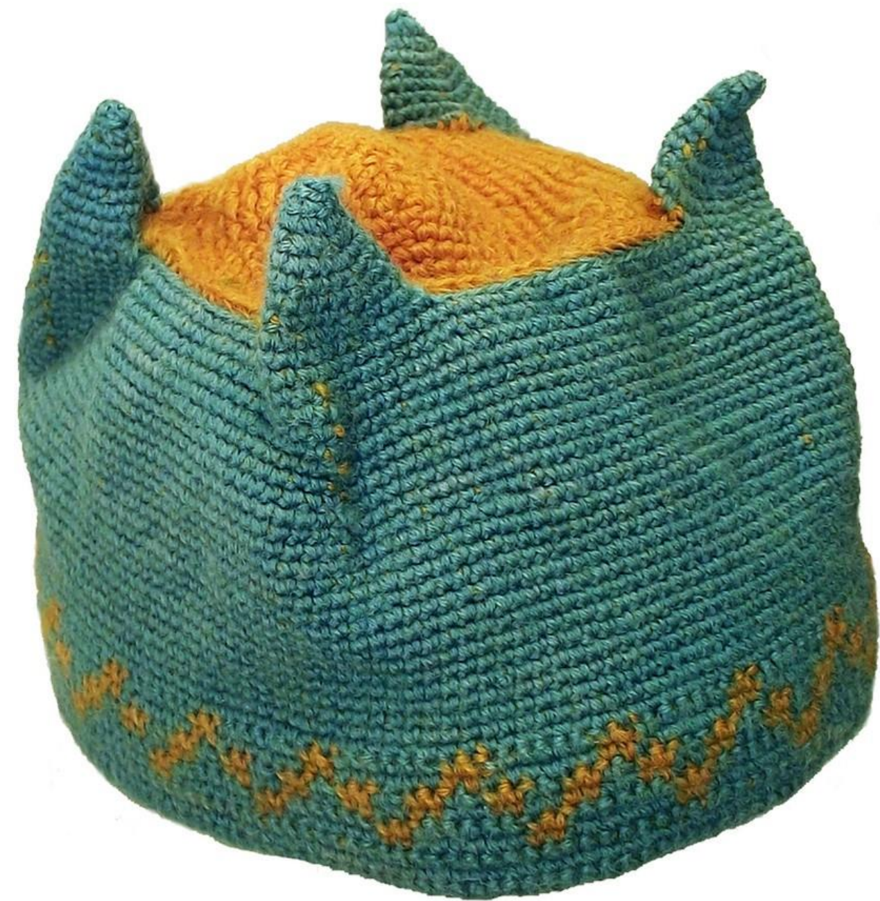
Reproducción gorros cultura Huari Técnicas de ganchillo