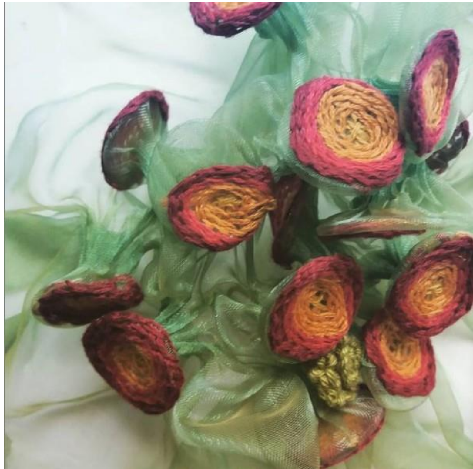
Detalle proyecto fertilidad y jardín