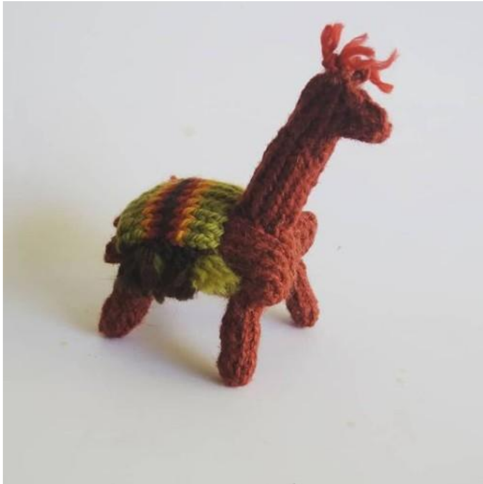
Figura volumétrica en técnicas de Anillado simple y cruzado