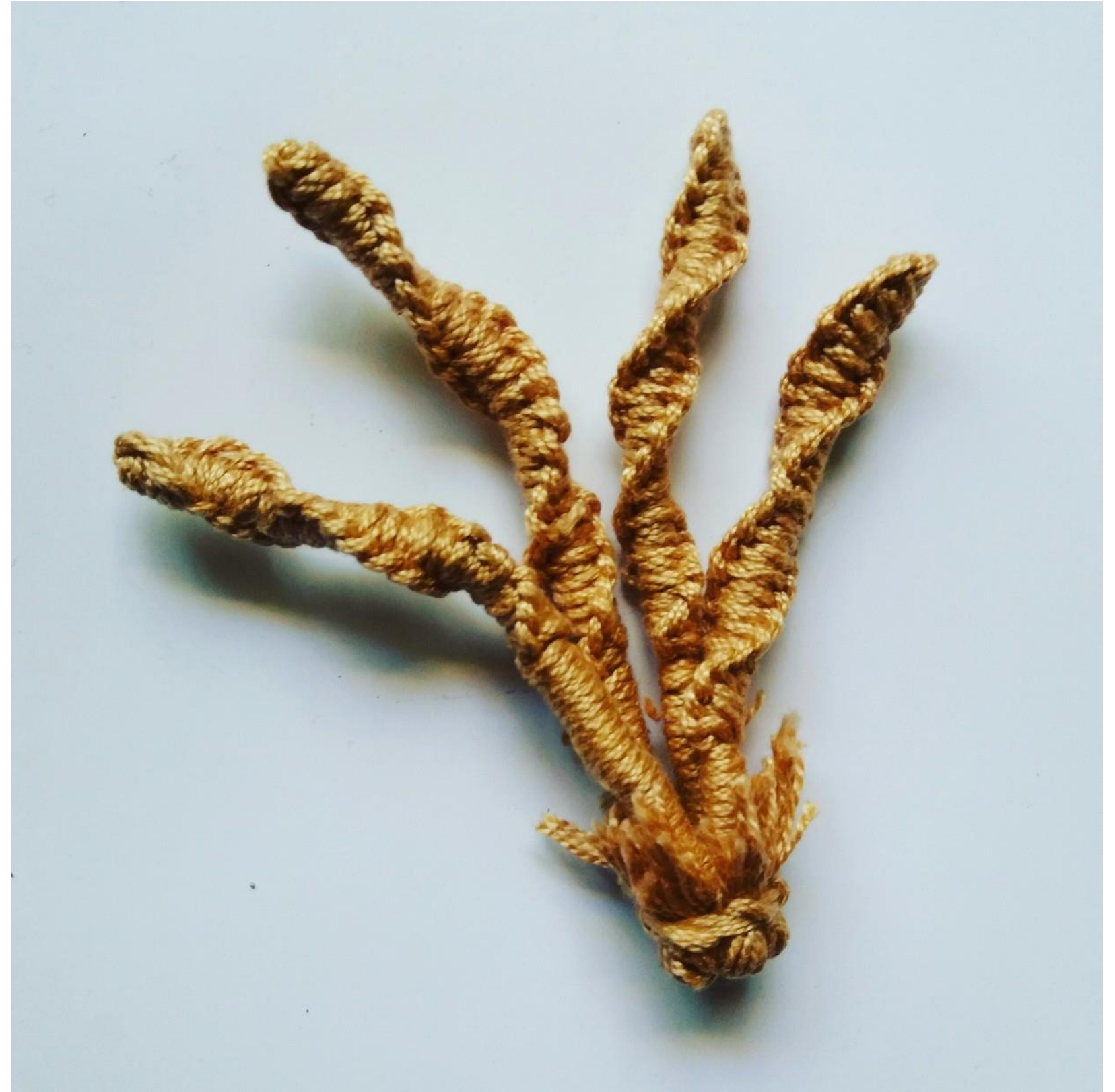
Reproducción de flores Traje Ceremonial Chimú Técnicas de Anillado simple y embarrilado