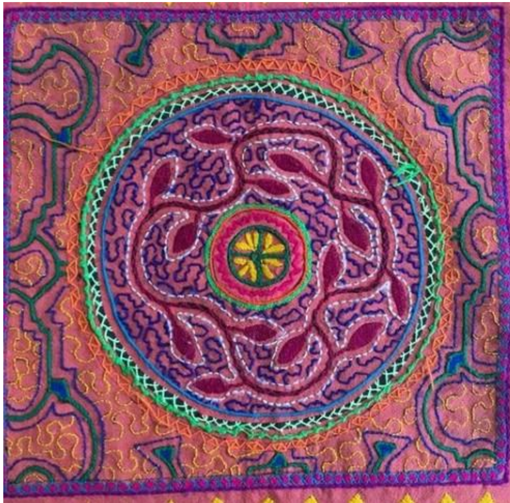
Técnicas de bordado de la cultura Shipibo