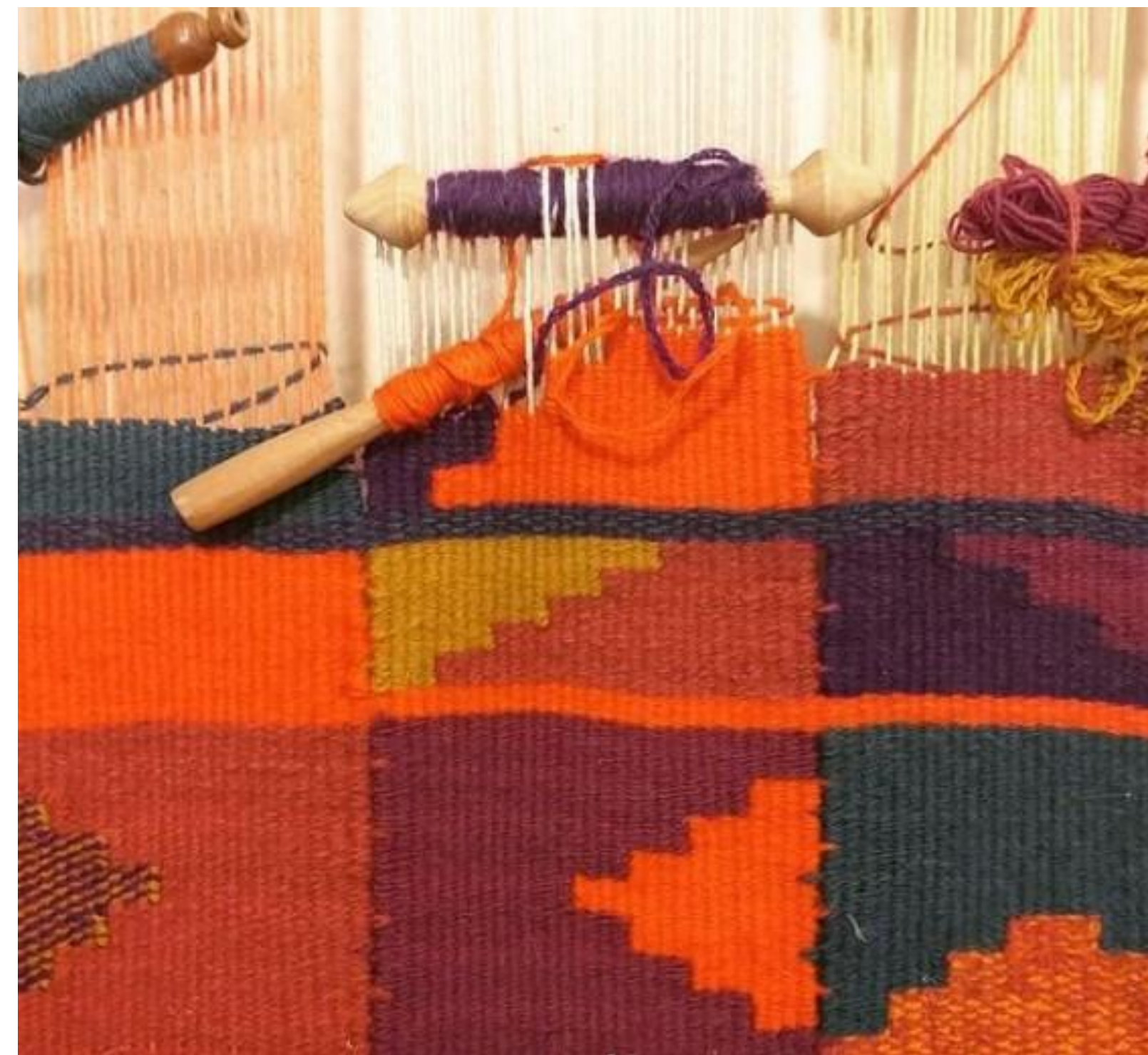
Proyecto Puka Técnicas de tapicería