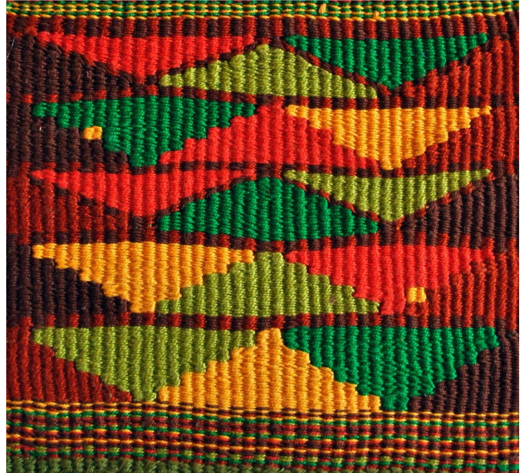
Técnicas de tapicería