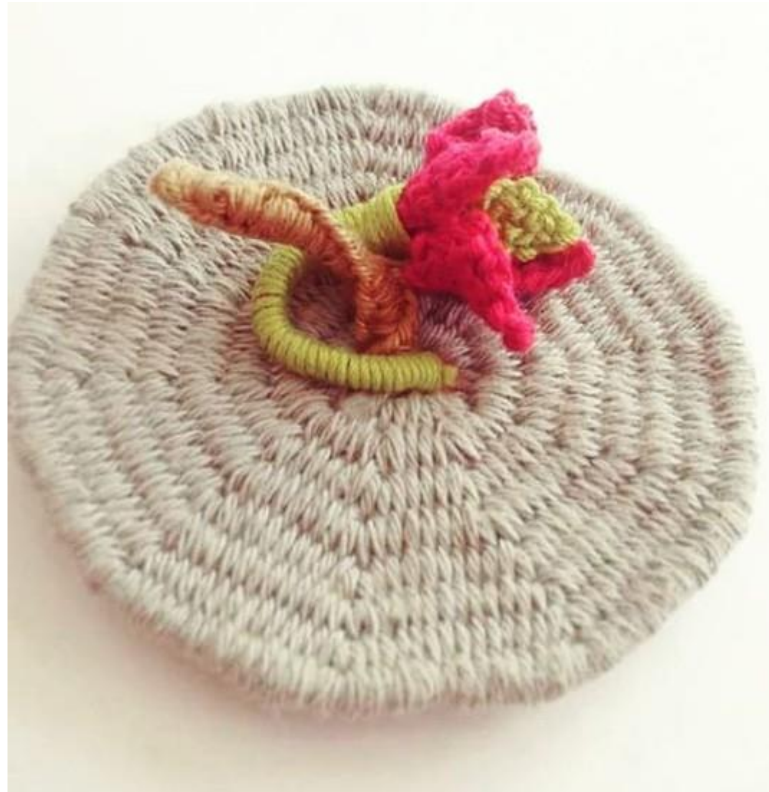
Reproducción de flor Traje Ceremonial Chimú Técnicas de Anillado simple, embarrilado y tapicería