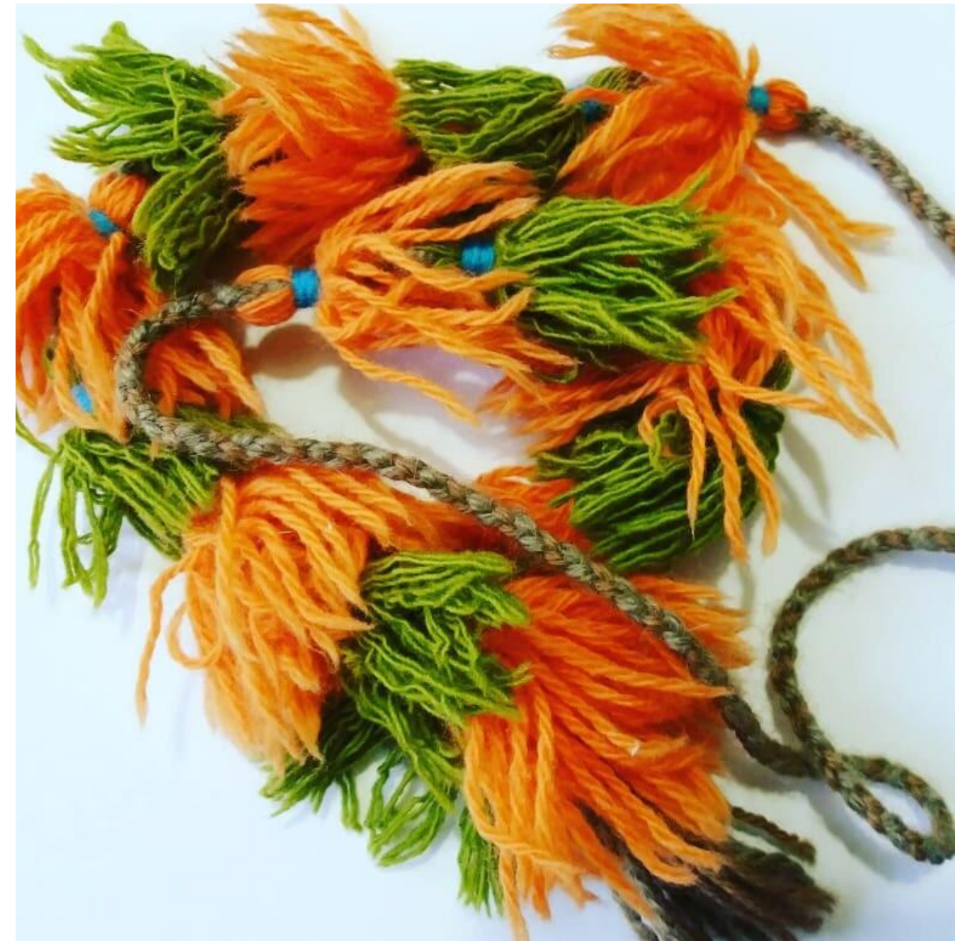
Borlas y pompones andinos